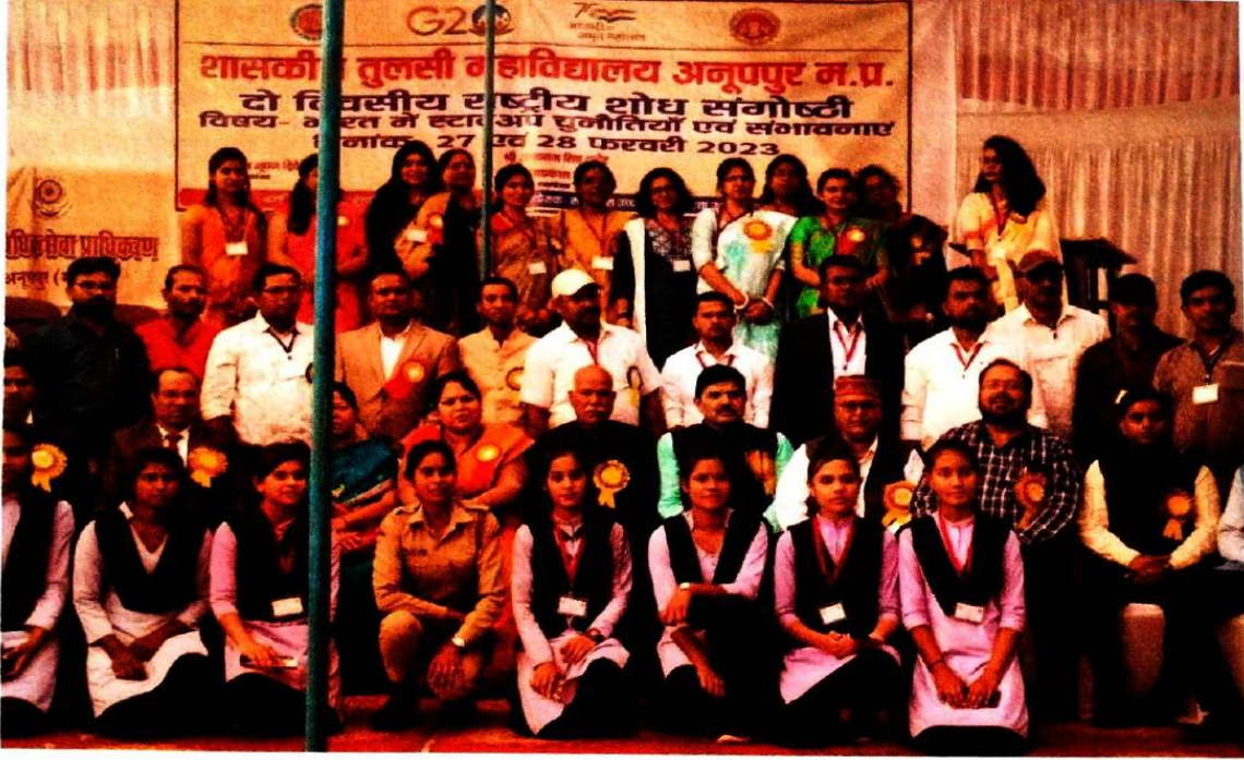
सेमिनार के प्रथम दिवस की ग्रुप फोटो